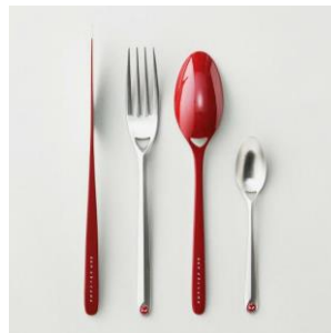
KEN OKUYAMA DESIGN STYLE 漆