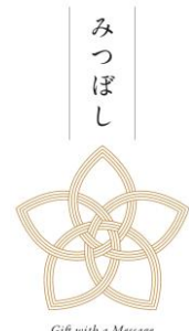
Gift with a Message