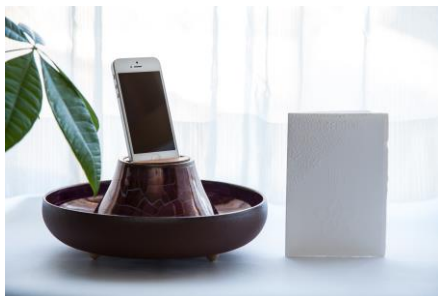
Ejp(East Japan Project) OTO

この度の商品ラインアップ拡充では、隈研吾氏がコーディネーターとなり東日本の伝統工芸職人と様々な国のデザイナーがコラボレーションした“新しい日用品”を提案するプロジェクト「Ejp ( East Japan P roject)」の製品や、日本人で初めてフェラーリをデザインした工業デザイナー 奥山清行氏デザインのカラトリーセット 漆（山崎金属工業）など、7ブランド26商品を追加し、合計14ブランド57商品のラインアップとなりました。